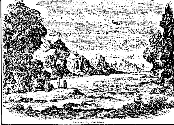
Pointe de la Baye, Evre Island.